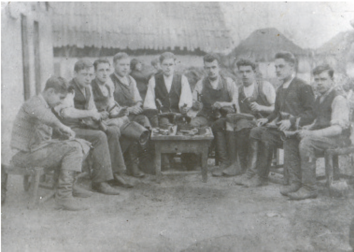
Рис.3. Шевський верстат, м. Тисмениця, 1932 р.

Про значне поширення шкіряних промислів у місті засвідчує копія стенографічного звіту Галицького сейму, де вказано про