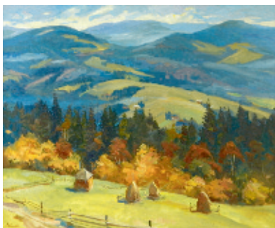
Осінь у Замагорі, 2014.