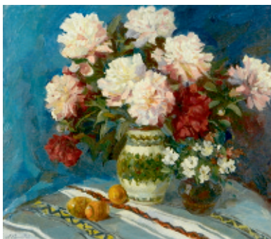
Травневий натюрморт, 2016.