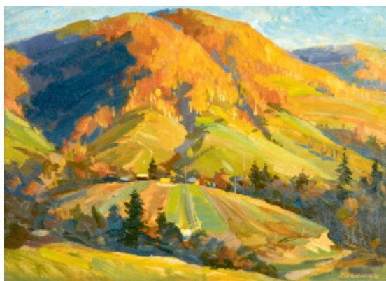
Бабине літо, 2012.