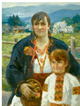
Космацькі писанкарки, 2017.