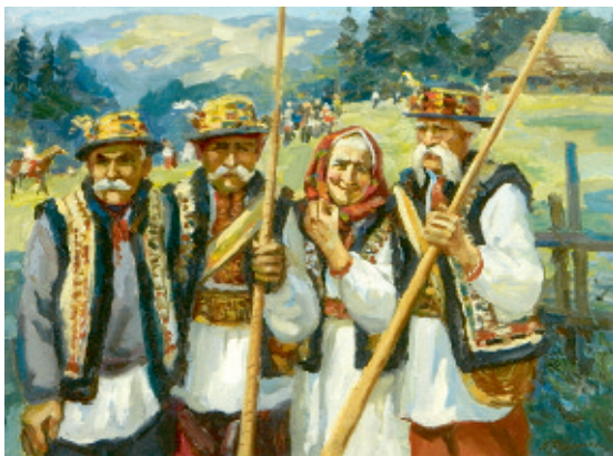
Проводи на полонину, 2012.