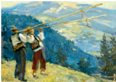
Свято у Карпатах, 2016.