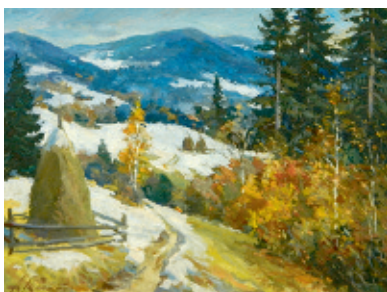
Перший сніг, 2014.