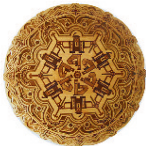
Рис. 6. Крицкалюк О. І. Декоративна тарілка "Аркан". 2006 р.