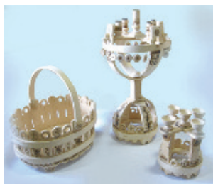
Рис. 3. Бельмега Ю. І. Набір Великодніх ужиткових речей. Випалювання. Дипломна робота. 2005 р. Керівник — Приймак Й. Д.