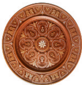
Рис. 1. Стефурак С. Д. Тематичний таріль "Щедра осінь". 2005 р.