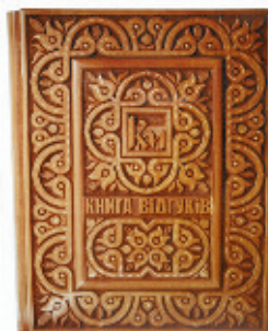
Рис. 9. Гавриш Л. Д. Книга відгуків "Ковальська майстерня". 2009 р.