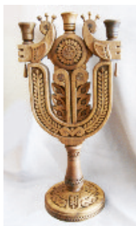
Рис. 8. Білий І. Свічник (курсова робота). 2011 р. Керівник — Радиш М. Б.