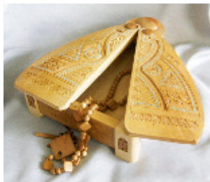
Рис. 7. Ковальчук П. Скринька (курсова робота). 2013 р. Керівник — Радиш М. Б.