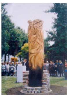
Рис. 4. Приймак Й. Д. Пам'ятний знак жертвам Другої світової війни серед цивільного населення. м. Фірзен-Дюлькен (Німеччина). 1995 р.