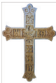
Рис. 5. Бзунько С. В. Хрест. 2000 р.