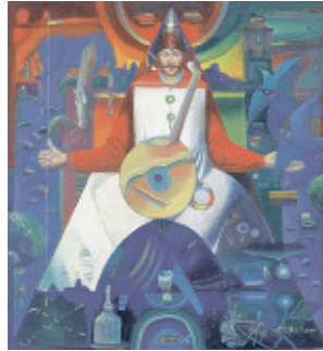
Орест Скоп. Козак Мамай, 2009 Полотно, темпера