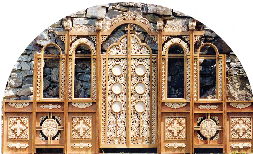
Іл. 3. Іконостас (Скит Манявський).