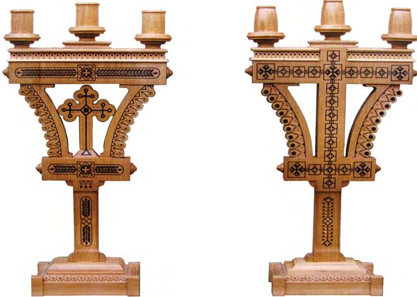
Іл. 2. «Свічники-трийці». Дипломна робота