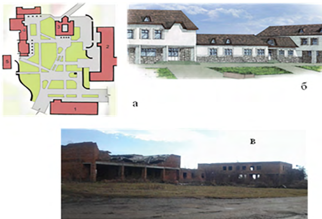
Іл. 4. Громадський центр с. Керниця Городоцького р-ну Львівської обл.: а – генплан громадського центру (проект): 1 – будинок культури; 2 – школа; 3 – адмінбудинок; 4 – торгово-побутовий комплекс; 5 – фельдшерсько-акушерський пункт; б – загальний вигляд торгово-побутового комплексу (проект); в – загальний вигляд торгово-побутового комплексу (сучасний стан)

Громадський центр с. Керниця Городоцького р-ну — один з останніх проектів кооперованих соціально-культурних центрів, що був запроєктований у радянській Україні та який з розпадом СРСР до кінця не був реалізований. Проектом передбачалась замкнута площа з центральною будівлею адміністративний будинку (сільська рада) (іл. 4). Торгово-побутовий комплекс громадського центру, який був завершений, але не переданий на баланс через розвал колгоспну, був зруйнований. Завершена будівля (накрита дахом, встановлені вікна, двері) за кілька років була розграбована місцевим населенням і сьогодні вона уже не підлягає відновленню. Сучасний громадський центр села це великі недоглянуті площі, чагарники, вирвані вікна, які свідчать про той факт, що будівлі радянського періоду є чужими для селян. Чужими з двох причин: це є спогад про радянську владу, де люди працювали у колгоспах за трудовні чи мізерну оплату праці. І друга причина: кожна громадську споруду селяни віками будували і утримували самі. Вони берегли її, бо це була їхня власність. З приходом радянської влади, колективізацією (конфіскацією майна і землі), утворенням колгоспів — все стало «нічиїм».