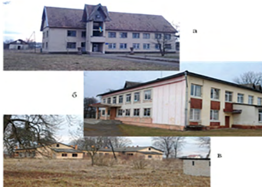
Іл. 5. Громадський центр с. Лисятичі Стрийського р-ну Львівської обл.: а – сільська рада; б – народний дім; в – дитячий садок.

Громадський центр села. Лисятичі Стрийського р-ну (іл. 5) характерний у планувальному відношенні дисперсним розташуванням об'єктів на території села. Через те, що занедбані об'єкти розташовані далеко від функціонуючих і не створюють єдиний комплекс, у селі не порушена гармонія архітектурного середовища. Такі особливості громадського центру, як невеликі за об'ємом будівлі та їх розосередженість, дали змогу селянам вибрати пріоритетні установи й експлуатувати їх. Позитивним є те, що в селі відроджується будівництво об'єктів торгівлі, бізнесу: млин, магазини, кафе; відновлені храмові будівлі, які за радянської влади були закритими.