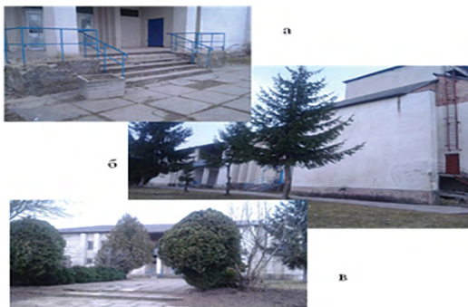
Іл. 3. Громадський центр с. Неслухів Кам'янка-Буського р-ну Львівської обл.: а – вхідна частина будинку культури; б – будинок культури; в – загальний вигляд громадського центру

Деградація архітектурного середовища об'єктів соціалістичної ідеології радянського періоду прослідковується у будівлі будинку культури громадського центру с. Неслухів Кам'янка-Буського р-ну: занедбана вхідна частина, відсутній благоустрій території, зруйнований фасад (іл. 3).