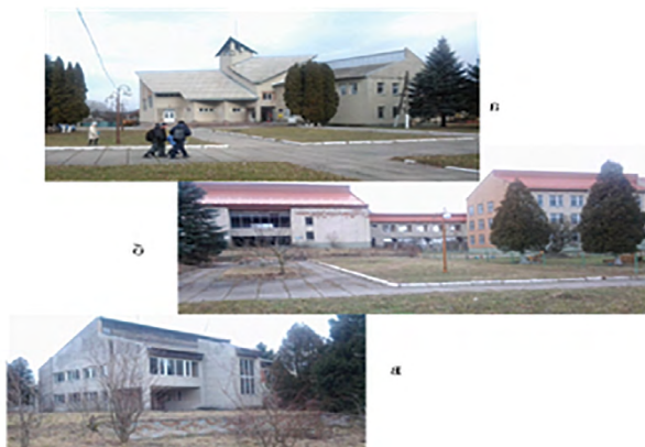
Іл. 1 Громадський центр с. Великосілки Кам'яно-Бузького р-ну Львівської обл.: а – будівля магазину; б – школа із спортивним залом; в – палац культури

ції радянського періоду (іл. 1). Центральна частина села у вигляді скверу з помпезними будівлями, які розташовані по периметру, є не пропорційною до оточуючого середовища села. За проектом громадського центру церкву не включають у загальне композиційне вирішення, будівлі споруджують повернутими «спиною» до храму. Лесть помітні через густі насадження обриси церкви дуже часто візуально перебиває пам'ятник радянському солдатові. Більшість будівель громадського центру, так як і благоустрій території перебувають у занедбаному стані. Загальне враження від споглядання комплексу громадського центру — деградує архітектурне середовище, дисгармонійне сільському оточенню.