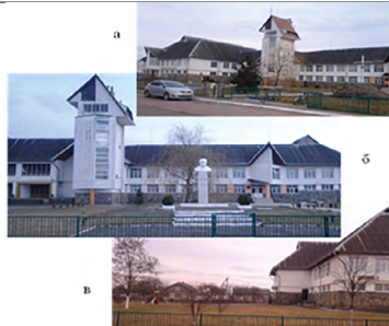
Іл. 6. Громадський центр с. П'ятничани Стрийського р-ну Львівської обл.: а – загальний вигляд; б – школа, на передньому плані пам'ятник Т. Шевченку; в – дитячий садок з магазином

Село Борщовичі Пустомитівського р-ну розташоване між Гологорами і Розточчям. Громадський центр відносно невеликих розмірів, розташований на схилі пагорба над озером, що створює гармонійно завершений архітектурний комплекс на фоні мальовничого природного пейзажу (іл. 7). Наявність дорожньо-транспортної інфраструктури (село розташоване в 20-и кілометровій зоні впливу м. Львова), компактність основної будівлі громадського центру та раціональне використання її різними установами: школа, дитячий садочок, сільська рада, будинок Просвіти дали можливість підтримувати його у належному стані. Транспортна доступність та мальовничість території дозволили залучити інвесторів до будівництва кафе-бару з відпочинковою зоною, які в комплексі з будівлею громадського центру та впорядкованою територією, дитячим майданчиком, сакральною зоною створюють гармонійне архітектурне середовище, яке є окрасою села.