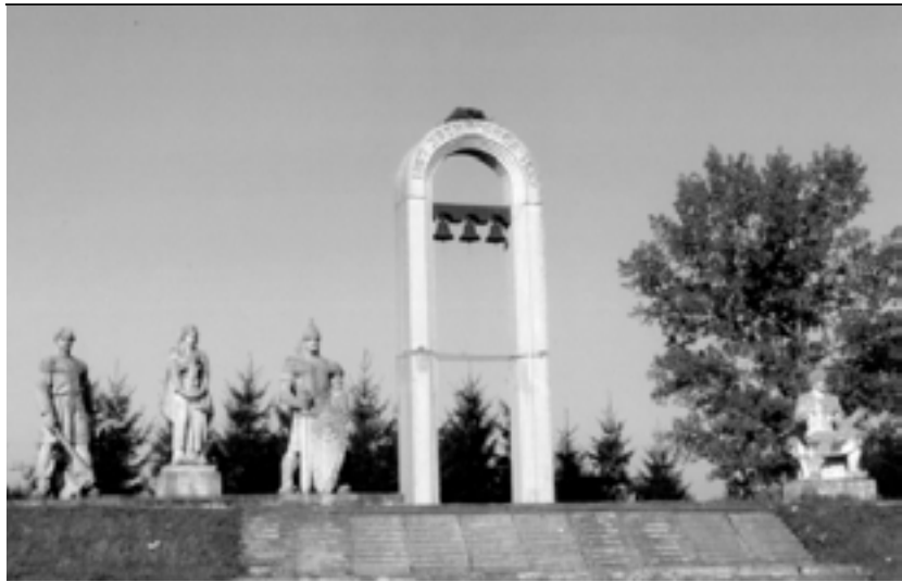
Монумент на честь 900 ліття Звенигорода. 1987 р., с. Звенигород, Львівська обл.