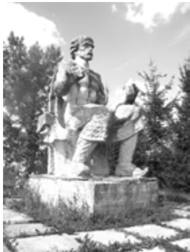
Літописень (фрагмент монумента)