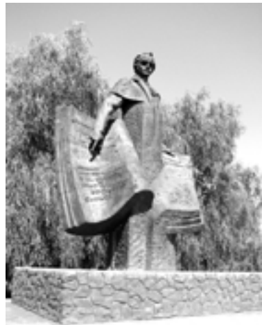
Пам'ятник Т. Шевченку. 1987 р., с. Давидів, Львівська обл.